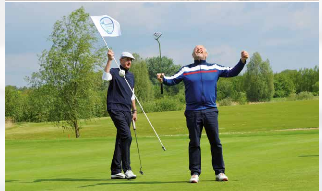
Das gesamte Aktivprogramm ist für Gäste des Hotelangebots „Frühlings-special: Wellness-Aktiv an der Ostsee“ ohne weitere Kosten nutzbar.